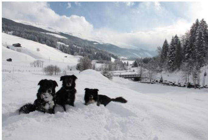
Anja, Mogli, Merlin & Malouk

Bis dahin wünschen wir Euch noch einen tollen Winter und ganz viel Spaß mit Euren Schnuffelnasen!